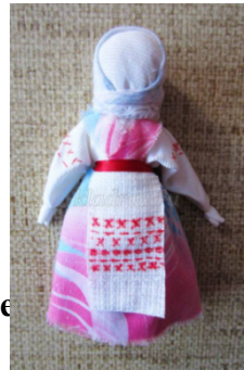
№2 «Интерье ой куклы: